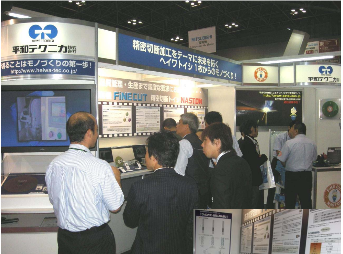
多くのご来場をいただき、ありがとうございました。

第 25 回 日本国際工作機械見本市 JIMTOF2010 が、有明『東京ビッグサイト(国際展示場)』にて 10 月 28 日から 11 月 2 日までの 6 日間にわたり“モノづくり 未来を創る 夢づくり”をテーマに開催された。ファインカット営業部門は、日本小型工作機械工業会の共同ブースにて 2 小間の展示を行った。今開催は、814 社 4,966 小間、来場者総数 114,558 人(重複なし)だった。“モノづくり大国 ニッポン”の最先端技術を世界に発信する展示会となった。