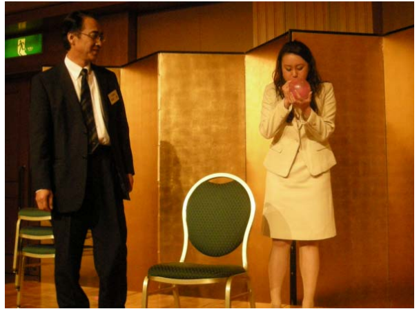
風船割りゲーム中です!