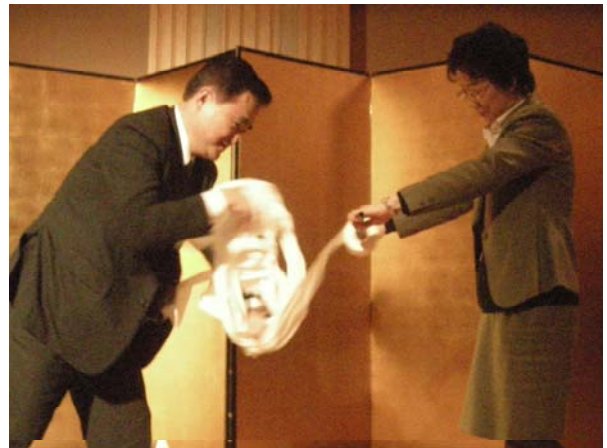
こちらも、ひたすら引っ張ってます!