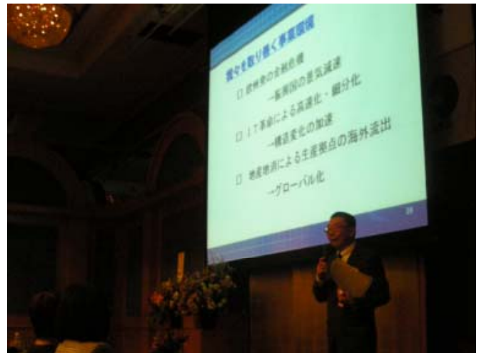
社長からの方針説明