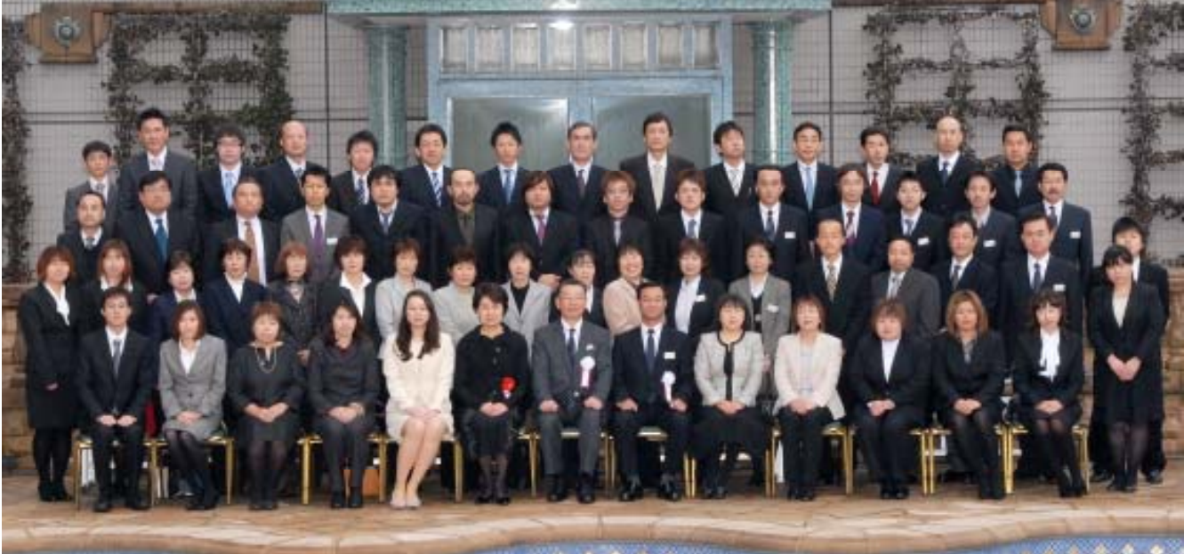
朝から降り続いた雨も上がり、ホテル『イースト 21 東京』の屋外プールにて記念撮影

平成24年2月25日、ホテル『イースト21東京』に於いて、第59回創立記念式典が開催された。式典では、株式会社大塚商会 丸山先生からスマートデバイスの基礎知識の講演をいただき、社長からは「改」から「新」へと題打ち、変化・革新こそが仕事の根幹との説明があった。また、那須工場の「絆から生まれた新」の報告では、目に涙する人もいた。創立記念祝賀会では、新人紹介やテーブル対抗ゲーム合戦が行われ、参加者のパフォーマンスに会場は大きな笑いと歓声に包まれた。