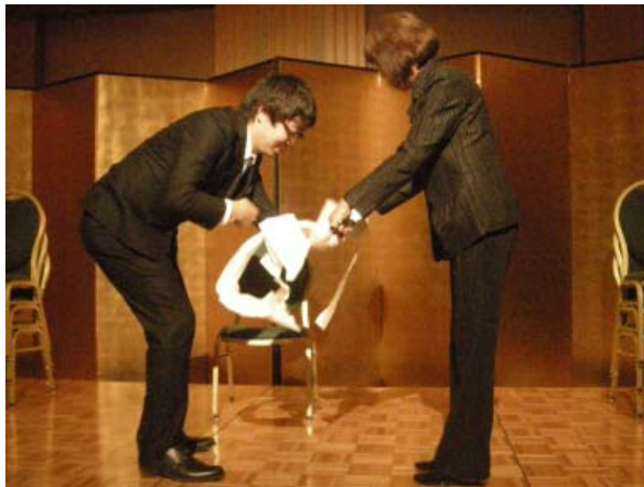
トイレトペーパー引っ張りゲーム中です!