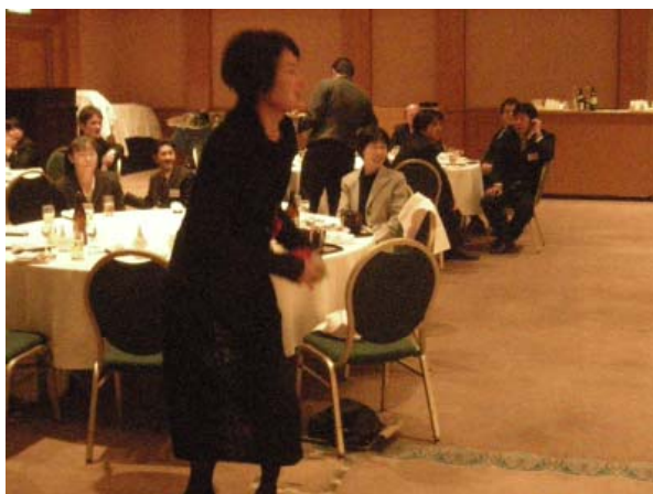
社長夫人は、缶倒しゲーム中です!