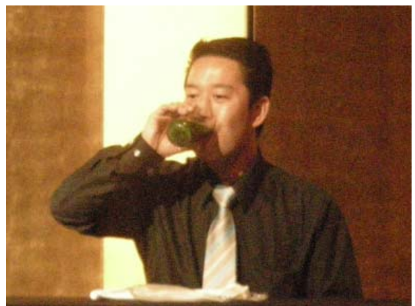
青汁早飲みゲーム中です!