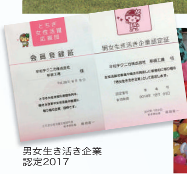
男女生き生き企業認定2017