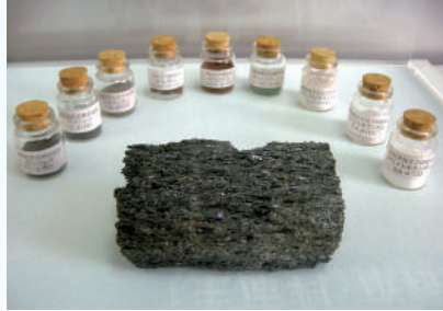
神奈川ショールーム