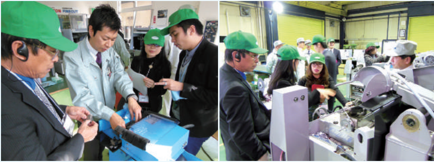
タイ国から工場見学